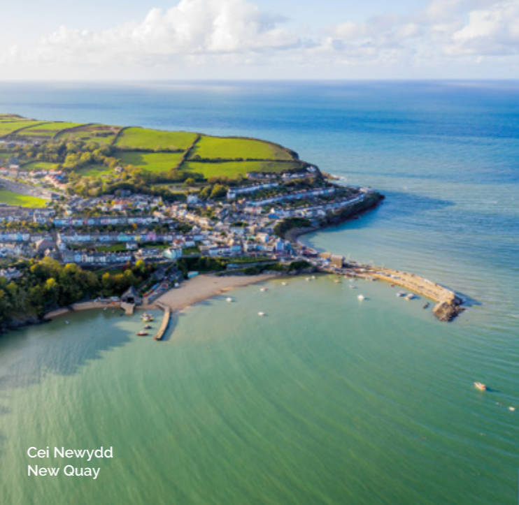
Cei Newydd New Quay