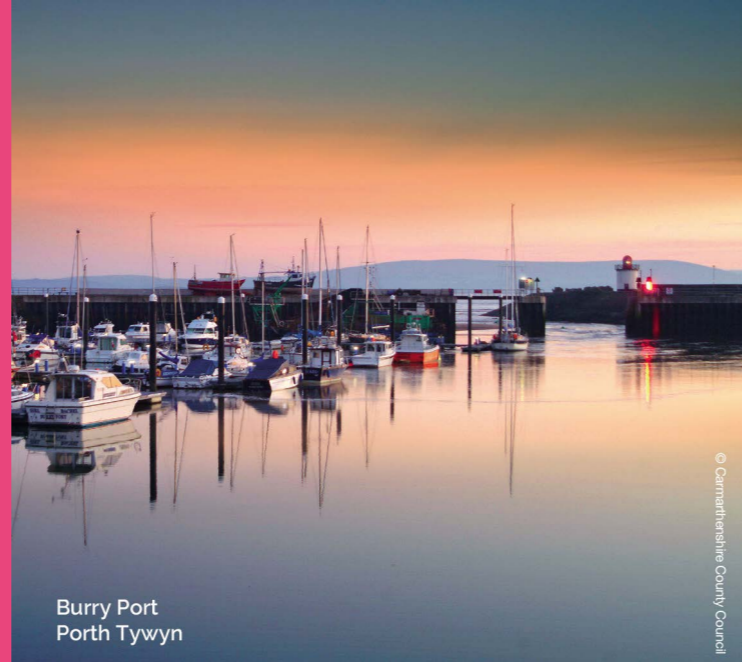
Burry Port Porth Tywyn