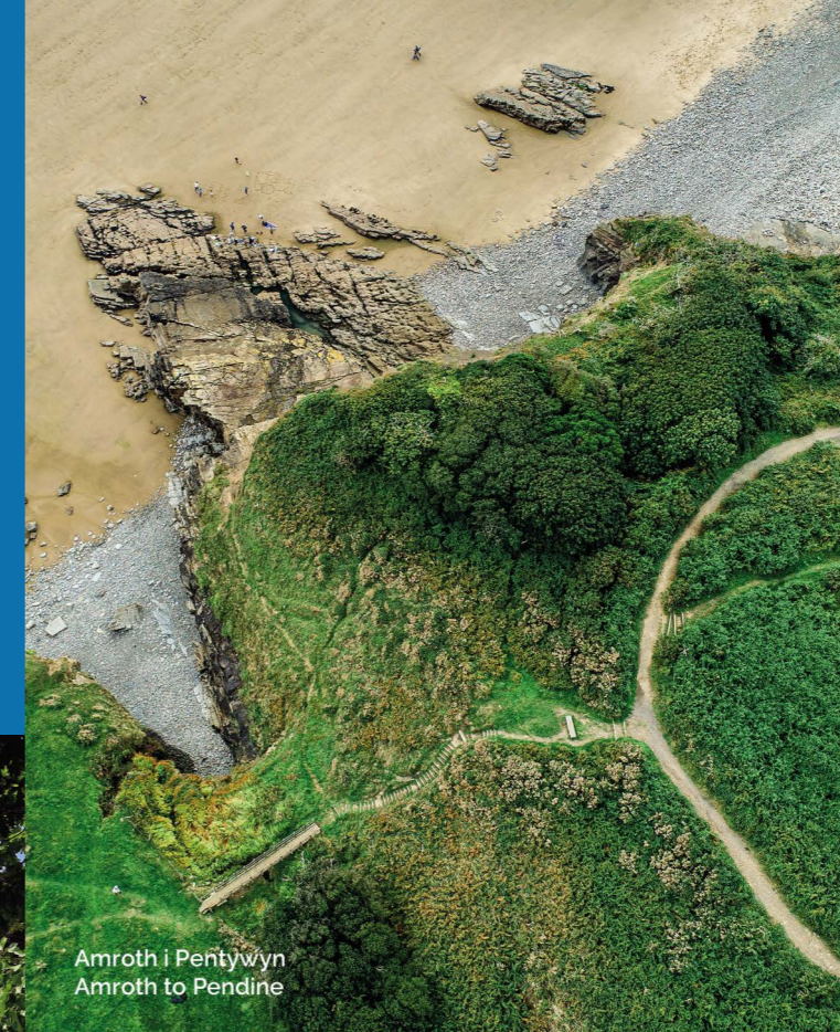
Amroth i Pentwyn Amroth to Pendine